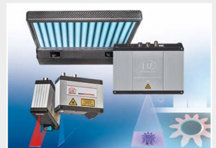
3D Messtechnik zur dimensionellen Prüfung und Oberflächeninspektion