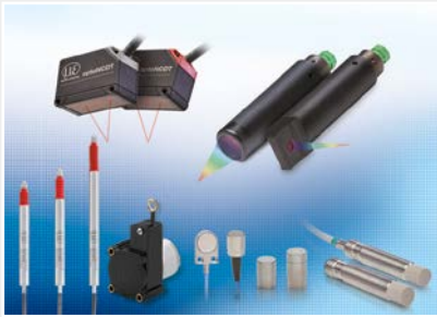
Sensoren und Systeme für Weg, Position und Dimension