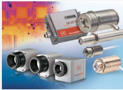
Sensoren und Messgeräte für berührungslose Temperaturmessung