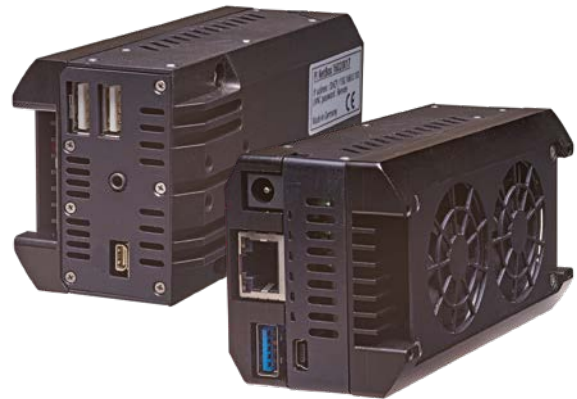
thermoIMAGER TIM NetBox