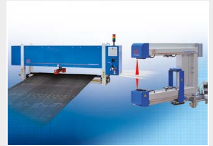
Mess- und Prüfanlagen zur Qualitätssicherung